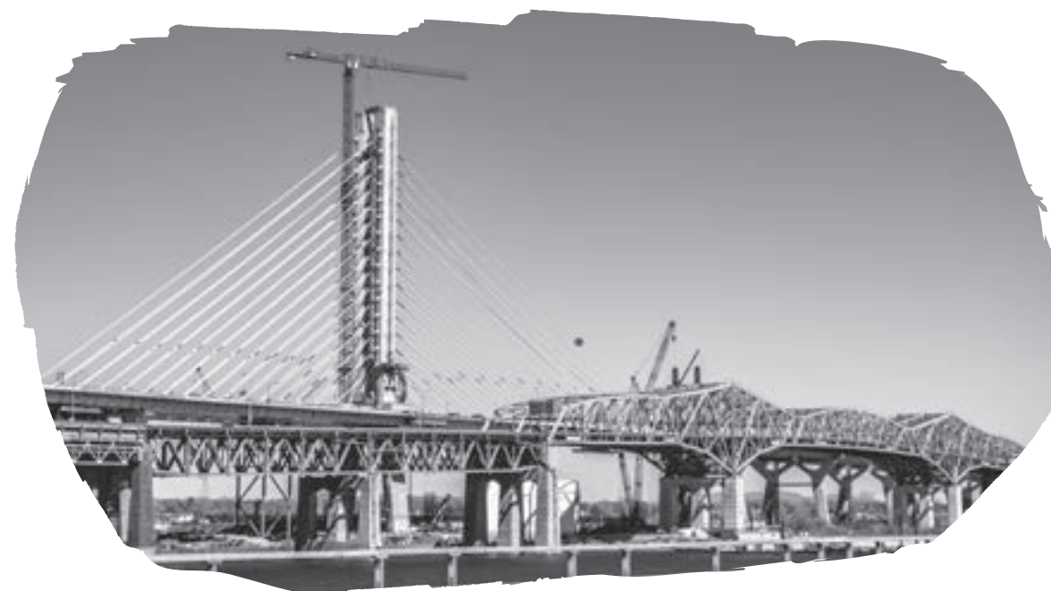
Le nouveau pont Samuel-De Champlain en construction et le vieux pont Champlain vus de l'estacade, Montréal, Québec, Canada.

Quelle sensation extraordinaire, loin de la plongée traditionnelle où souvent on avance au rythme lent des coups de palmes. Sans courant, la moyenne est de 75 0,9 kilomètre à l'heure, et maintenant, j'avance 10 fois plus vite en ayant augmenté la rapidité du propulseur. Je m'amuse. J'oublie un instant le sérieux du projet et les kilomètres qu'il me reste à parcourir. Je vis intensément le moment. La température de l'eau est agréable, à 21 °C. En dépit de la fatigue, je ne ressens pas le froid. Pourtant, depuis jeudi matin, j'ai dormi à peine six heures qui n'ont pas été des plus reposantes. 80 — On a passé les deux ponts Champlain. Tu avances vraiment vite, me lance Lili qui doit commencer à se demander si l'équipe de relais sera arrivée avant moi au pont Jacques-Cartier.