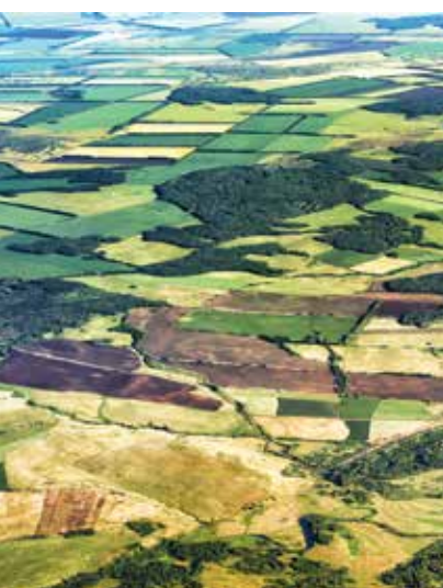
Table des matières Fascicule Mes bases en géo