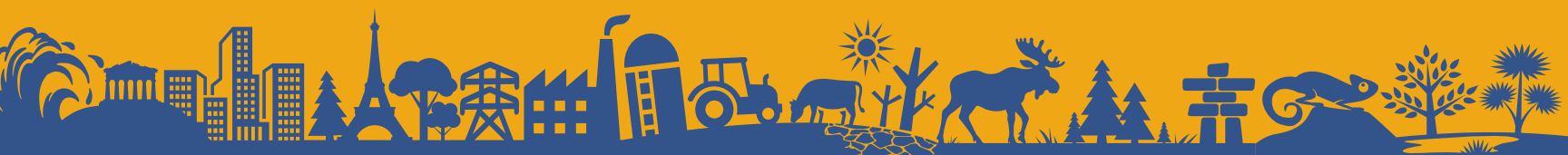
Table des matières complète de la collection